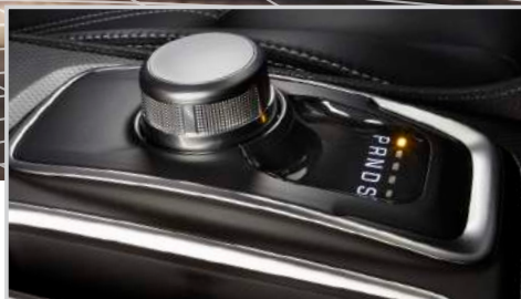
Transmisión automática de 8 velocidades con E-shift rotativo