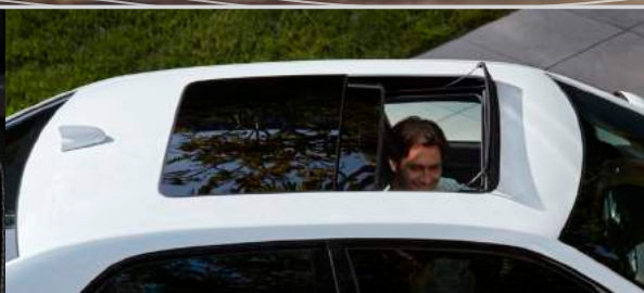
Quemacocos panorámico dual