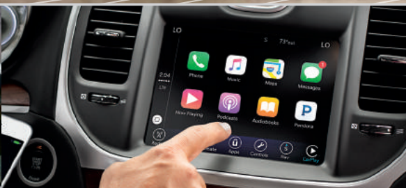
Tecnología Apple CarPlay/Google Android Auto