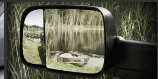
Espejos de arrastre*