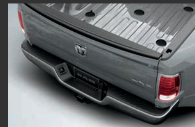
Preparación para Gooseneck en batea