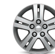
// DE ALUMINIO PINTADO DE 17"