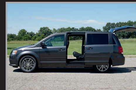
Compuerta trasera y puertas laterales deslizables eléctricas