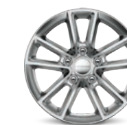
// DE ALUMINIO DE 17"