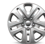
// DE ACERO CON TAPÓN COMPLETO DE 17"