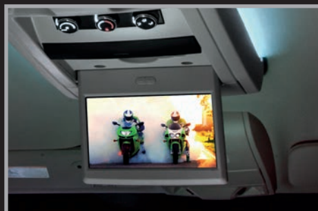
Pantalla de video entretenimiento de 9" en 2ª fila