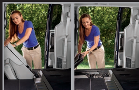
Segunda fila de asientos con sistema Stow-and-Go®, abatibles bajo el piso