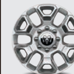
Llantas LT285/60 R20E OWL