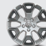
Llantas P275/60 R20 All Season

ALUMINIO DE 20" ACABADO CARBÓN SATINADO CON INSERTOS EN GRIS MINERAL