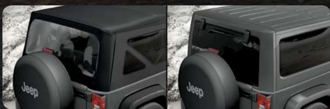
Todo dual: suave y rígido