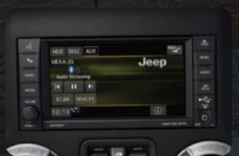
Sistema multimedia Uconnect®